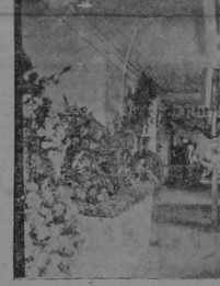
Detalle del conjunto floral presentado por el señor Brade al concurso floral de la Exposición Nacional, y que mereció el primer premio.