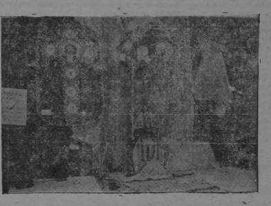
Parte de la sección en la cual exhibió el Hospicio de Huérfanos de esta capital, y los cuales fueron premiados con medalla de oro.